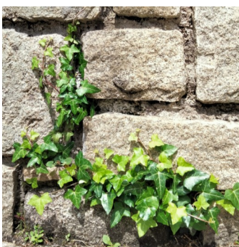
Le réensauvagement peut être l'absence d'intervention humaine sur une surface très limitée.

Mardi 18 juin, si le temps le permet, c'est le comptage des engoulevents dans les Landes de Locarn. Renseignez-vous auprès de Maël 02 96 36 66 11.