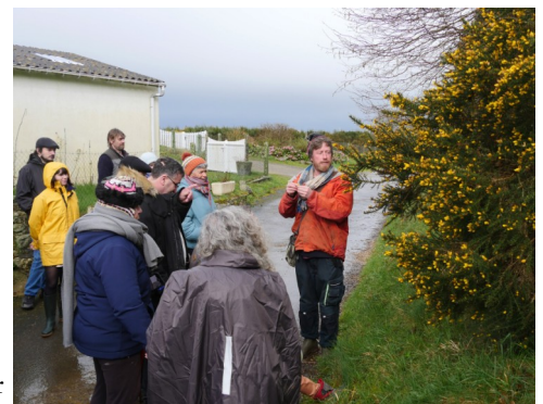
Balade sur le thème de l'adaptation.