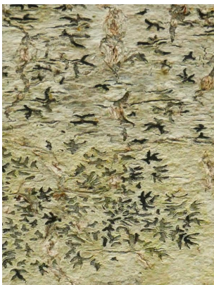
Détail de grapidacées à Kergrist-Moëlou