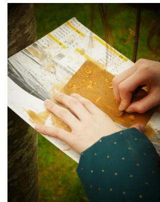
Mona-Louise s'inspirant de ces lichens