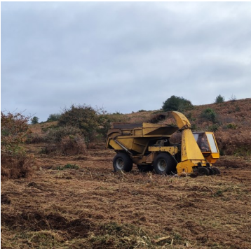
Broyeur-exportateur de l'entreprise Digard

La fin d'année 2024 sur les landes de Locarn a été marquée par deux chantiers : un broyage-export et un débardage de bois. Un broyage-export ? Habituellement, sur la lande, la méthode employée était plutôt la fauche-export pour régénérer la lande en appauvrissant le sol, favorisant ainsi les plantes des milieux **oligotrophes** (pauvres en matière organique) comme les bruyères et les ajoncs de nos landes bretonnes.