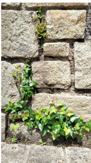
Lierres et fougères s'accrochent au ciment

On vous en parlait dans la lettre n°14, vous vous souvenez ? Et bien le concours photo est lancé, depuis le 1 er mars sous le nom de « Nature Sauvage ? ».