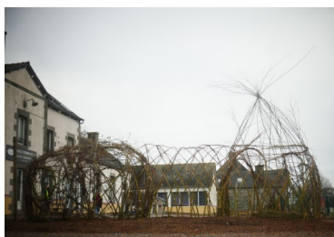
Structure en osier vivant à l'école de Laniscat - Bon-Repos-sur-Blavet