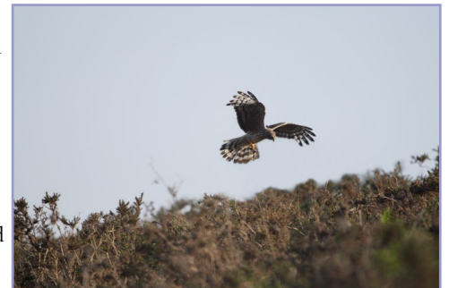
Busard Saint-Martin dans les Landes de Locarn.