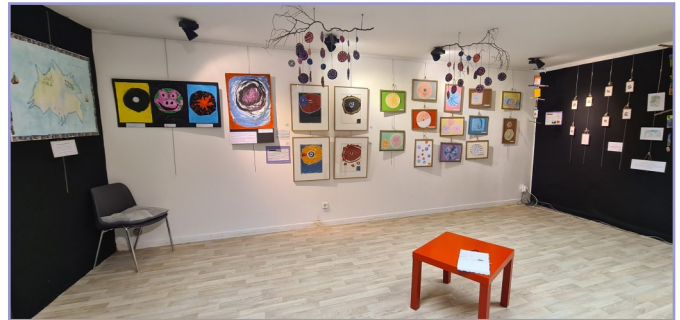
Les œuvres des enfants entourant, au centre, les œuvres de F. Dilasser