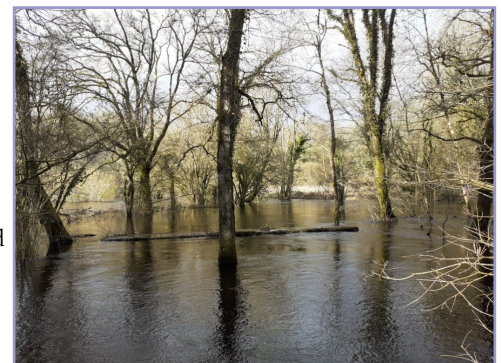
Le Blavet, à Trémargat.