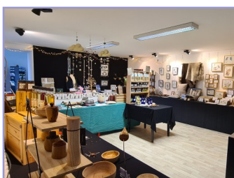
Cicindèle fête Noël 2025