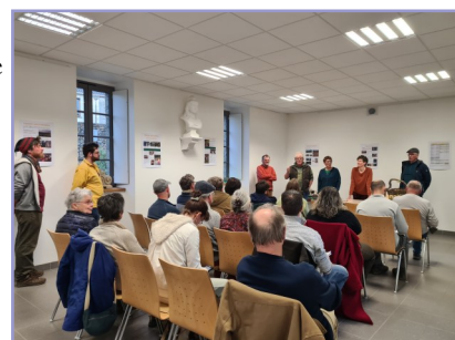
Assemblée générale 2025